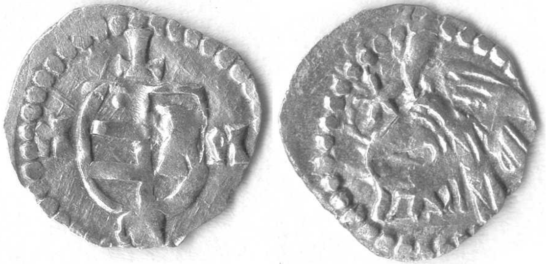
Figura 3. Ban muntean atribuit voievodului Vladislav al II-lea. Figure 3. Wallachian ban attributed to the woiwode Vladislav II.