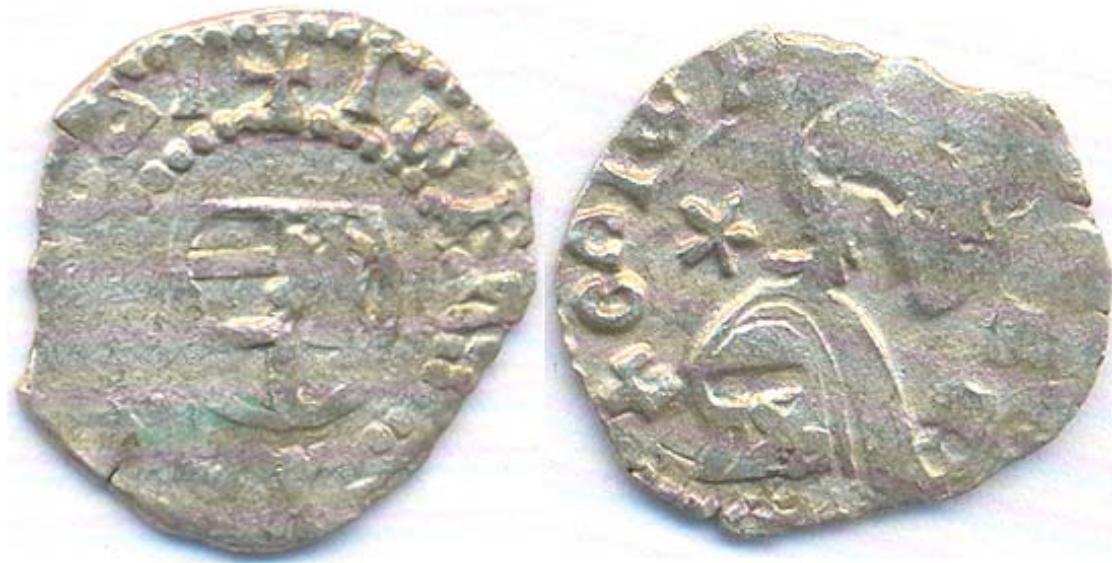
Figura 1: Ducat muntean atribuit voievodului Vladislav al II-lea (1447-1448, 1448-1456). Figure 1: Wallachian silver ducat attributed to the woiwode Vladislav II (1447-1448, 1448-1456).